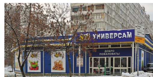
РТЦ «Смолл», Бирюлевская ул., 26А