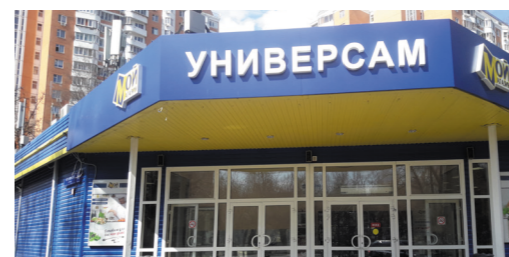
РТЦ «Смолл», Черноморский бул., вл. 10