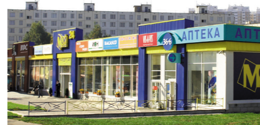
РТЦ «Смолл», Пролетарский пр-т, 2А