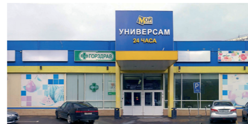
РТЦ «Смолл», Шипиловская ул., 62А