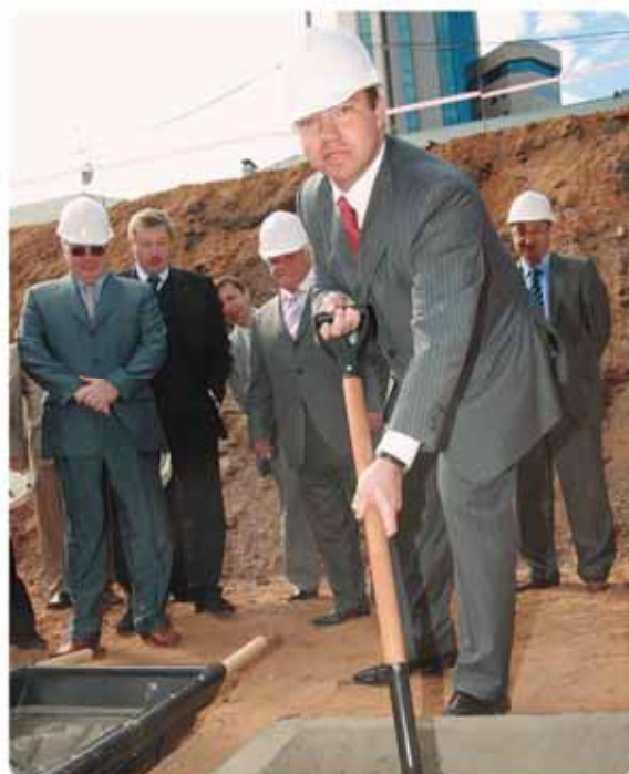
«Я не классический банкир. Много времени провожу на стройках».

я думаю, «Гарант-Инвест» в таких рейтингах был бы одним из лидеров.