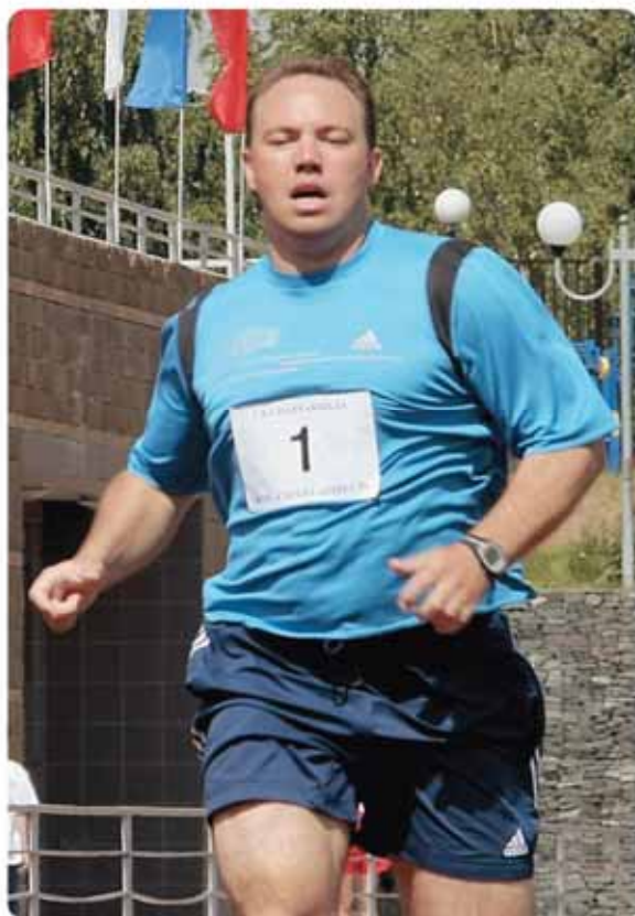
«Много бегаю. Зимой – на лыжах. Летом – кросс».

Я хочу сказать, что в каких-то сегментах строительного рынка кредитование, безусловно, сократится, а в каких-то изменений практически не будет, кризисные явления обойдут их стороной. Сейчас много спекуляций по поводу кризиса, все пытаются завесить планку.