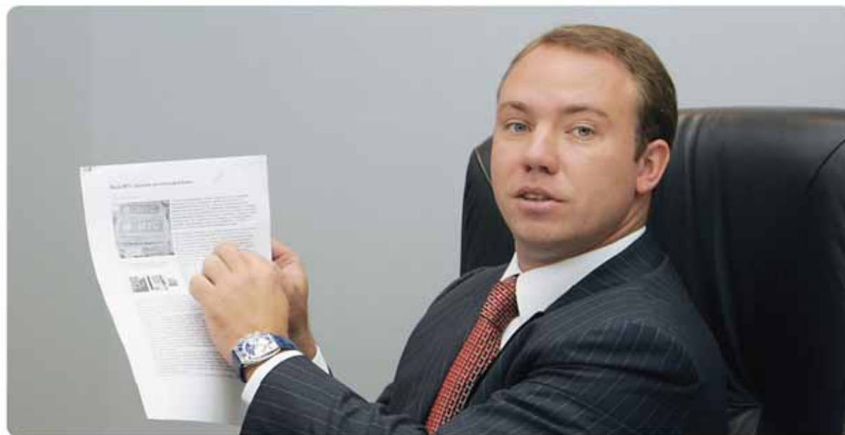
«Уверен, что мы не потеряем ни одного клиента, возможно, даже приобретем новых».

При финансовом участии банка «Гарант-Инвест» был создан целый ряд предприятий. Компания «Монитор-Тайм» занималась девелопментом торгового комплекса «Галерея Аэропорт», а теперь управляет им (открыт в мае 2003 г.). «Гарант-Инвест Недвижимость» управляет строительством многофункционального торгово-развлекательного комплекса рядом с м. «Каширская». Компании «Гарант-Трейд М» и «Гарант-Трейд» созданы для развития торговой сети магазинов шаговой доступности (сегодня сеть «Мой магазин» включает 15 универсамов). «ГарантСтройИнвест» на Варшавском шоссе построила и управляет ТЦ «Ритейл Парк». В 2005 г. было построено несколько районных торговых центров, в 2006 г. введен в эксплуатацию ТЦ «Коломенский», в 2007 г. ТК «Пражский Град». Тогда же ФПК расширила свое присутствие на рынке недвижимости за счет строительной ассоциации «СтройСервис» и новой компании «Гарант-Инвест Девелопмент». К 15-летию будет открыт Торгово-Деловой Комплекс «Тульский» с одним из лучших офисных центров Москвы, торговой галереей и 4 ресторанами.