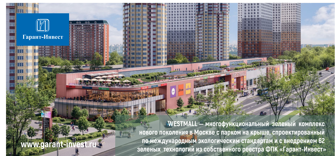
Реклама. ФПК «Гарант-Инвест». erid=LdtCKRSqb